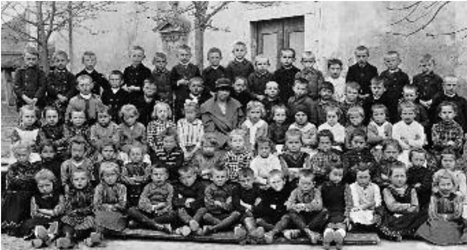
Die Kinder des Schuljahres 1918/1919 vor der Kirche.