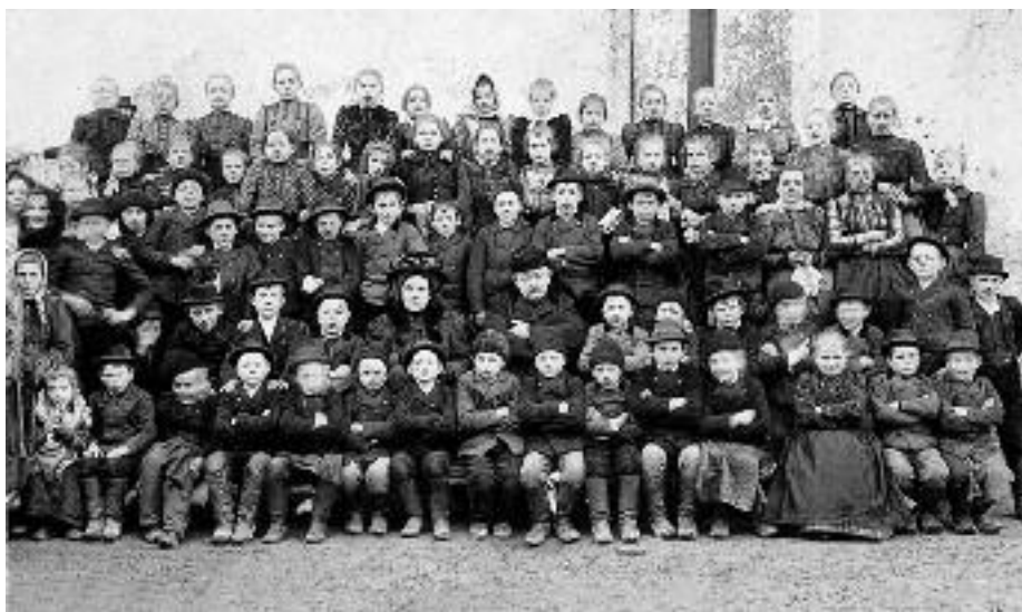
Das älteste Schulfoto aus dem Jahr 1908!