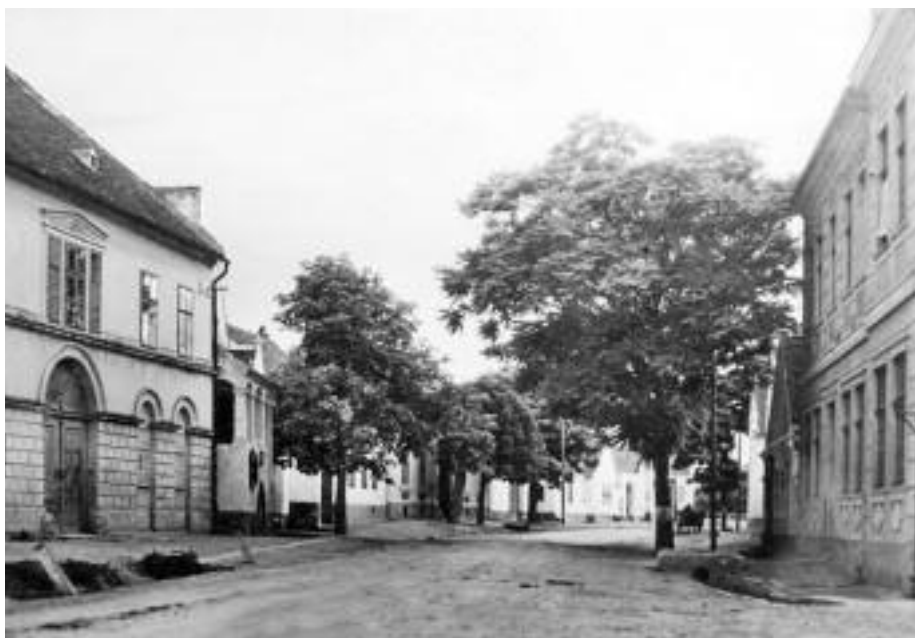
Das Trausdorfer Ortsbild im Jahr 1940: Links die Volksschule, rechts der Pfarrhof.