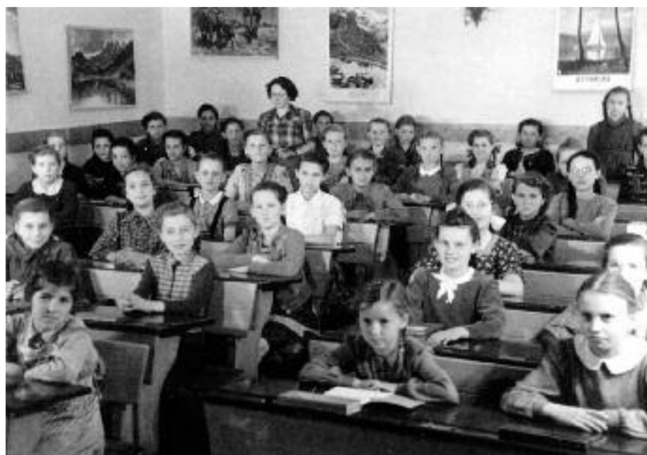
Die Trausdorfer Schüler im Jahr 1949.

In den Sommerferien des Jahres 1973 wurden an unserer Volksschule größere Renovierungsarbeiten durchgeführt. Die Toilettenanlagen im Schulhof wurden abgerissen und in die ehemalige Schuldienervohnung verlegt. Der Handarbeitsraum wurde zum Umkleideraum umgestaltet und im Gangbereich wurde ebenfalls der Fußboden erneuert. Ebenso wurde der Schulhof vergrößert und gegen Ende Mai 1974 asphaltiert. An der hinteren Wand, wo sich die Toilettenanlagen befanden, wurden Sträucher und Bäume gepflanzt.