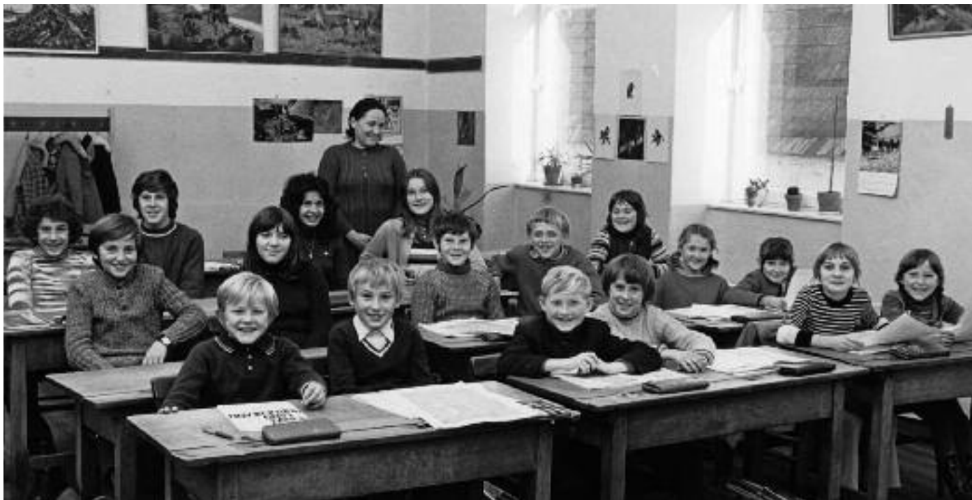
Die Kinder der 4. bis 8. Schulstufe im Schuljahr 1972/73.