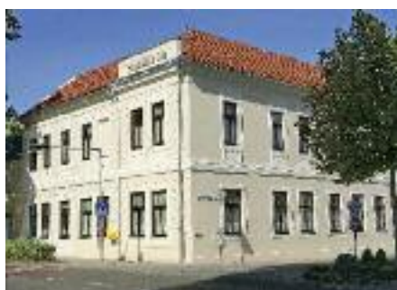
Die Trausdorfer Volksschule nach der Sanierung von Dach und Fassade im Jahr 2012.