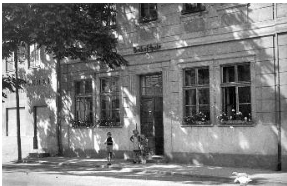
Viele Trausdorfer/innen erinnern sich noch daran: Früher befand sich der Eingang zur Volksschule auf der Hauptstraße.