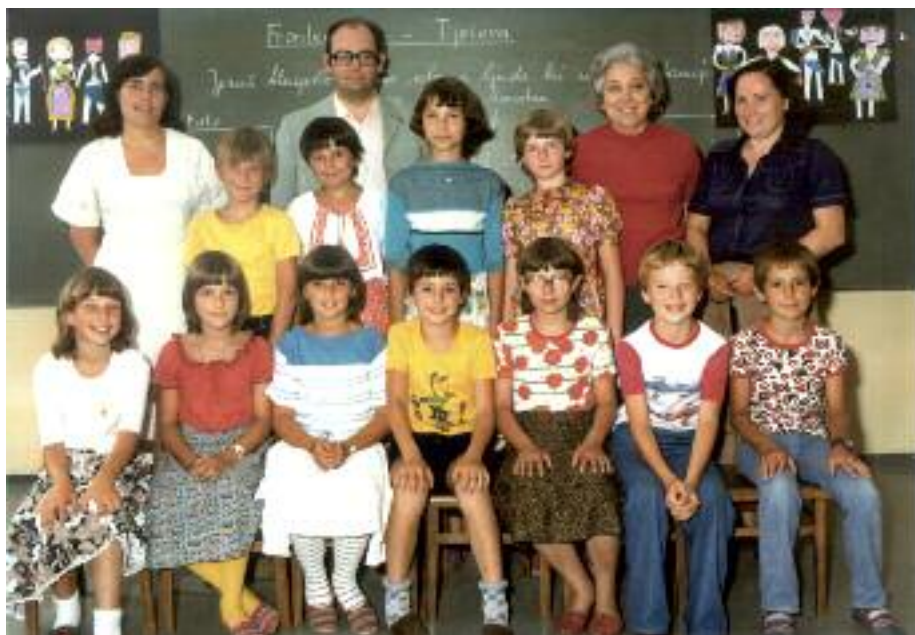
Die 4. Schulstufe im Schuljahr 1978/79.

Eine völlig neue Situation brachte das Schuljahr 1998/99 mit sich, da wir erstmals nach 47 Jahren 5-klassig wurden.